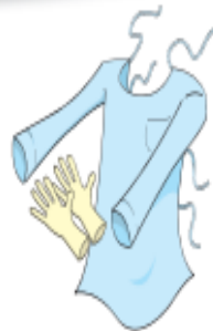
Luvras e Avental