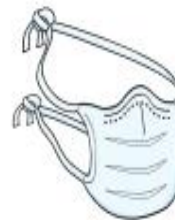
Máscara Cirúrgica (paciente durante o transporte)