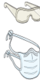
Óculos e Máscara