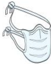
Máscara Cirúrgica (profissional)