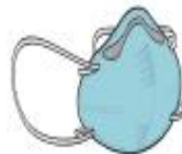
Máscara PFF2 (N-95) (profissional)