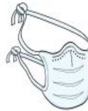
Máscara Cirúrgica (paciente durante o transporte)